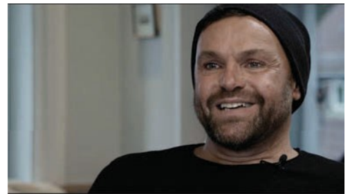
IMAGE- UND WERBEFILM - MUT, HILFE, HOFFNUNG. EIN EINBLICK IN UNSERE ARBEIT